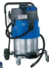
ATTIX 761-21 XC